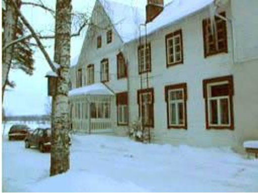
Kangasalan Lepokoti talvella 1999

Kangasalan Lepokodin kunnostustyöt aloitettiin ”virallisesti” ja tehokkaasti vuonna 1993 päärakennuksen vesikaton kunnostuksella. Vanha vesikaton huopakate oli päässyt vuosien saatossa pahasti ränsistymään, ja siitä oli aiheuttanut vesivuotojen muodossa osin pahojakin vaurioita etenkin rakennuksen toisen kerroksen huonetiloihin.