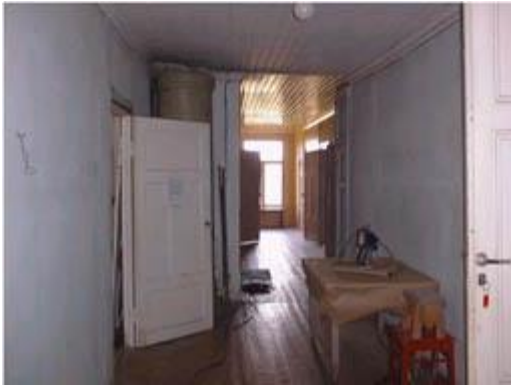
Käytävän kunnostamaton osa (kunnostus käynnissä maaliskuussa 1999)

Päärakennuksen kaikki savuhormit nuohottiin, ja tulipesät korjattiin tarvittavassa laajuudessa talvella 1997/1998.