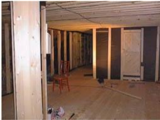
Ullakolle rakennettiin kokonaan kipsilevyllä verhoiltu varastuhuone Lepokodin eri säilytystarpeita varten

Kangasalan Lepokodin ja siihen kuuluvien rakennusten kunnostustöiden valmistuminen oli suunniteltu tapahtuvaksi vuoden 2000 alkuun, mutta tämä aikataulu ei pitänyt, ja nyt onkin tällä hetkellä pienen "hengähdystauon" hetki menossa.