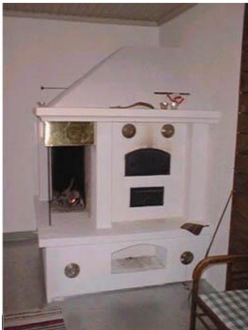
Saunarakennuksen uusi takka/ leivinuuni-yhdistelmä

Saunarakennuksen sisäpuolen kunnostuksessa tehtiin eniten varsinaisia muutoksia rakennuksen alkuperäiseen huonesijoitukseen verrattuna. Rakennushan oli katsottava tavallaan uudisrakennukseksi, sillä suuri osa sen pintarakenteista oli tehty uudelleen.