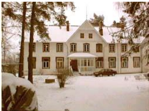
Päärakennus etujulkisivun puolelta. Hirsipinnat maalattiin maitomaalilla.

kalusteet ovat joka huoneessa samanmalliset varta vasten Lepokotia varten teetetyt, joten jo tämä seikka tekee ko. kalusteista hyvin arvokkaan kokonaisuuden rakennuksen irtaimistossa.