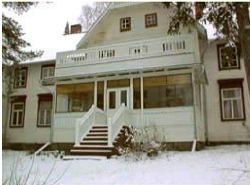
Ukkijärven puolella oleva lasikuisti rakennettiin lähes kokonaan uudelleen

Kesän 1997 aikana kunnostettiin myös nk. pikkumökin vesikatto, joka sai tässä yhteydessä uuden punaisen huopakatteen.