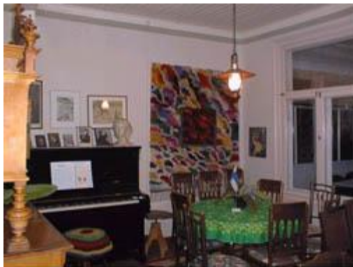
Sali. Kuvassa näkyy Lepokodin yksi erikoisuuksista: Kangasalla valmistettu piano!

Huone on saanut nimensä historiasta, sillä olihan Lepokoti käyttänyt joskus jopa lehti-ilmoituksessa "tärppinä" mainintaa, että "talossa oli myös radio", ja ko. laite oli sijoitettu tähän huoneeseen.