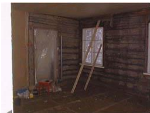
”Finnan huone” ennen pinkopahvien asennusta talvella 1999

Seuraavaksi alkoi kunnostustöiden suurin ja työläin vaihe. Sekä saunarakennuksessa että päärakennuksessa oli todettu ulkovaipan hirsissä paikoin laajojakin lahovaurioita. Etenkin saunarakennuksessa ne olivat niin pahoja, että kokonaisia seinäosia jouduttiin uusimaan. Välillä korjausmiehitys joutui miettimään ”päänsä puhki”, miten rakennusosia tuetaan väliaikaisesti kokonaisten seinien purkutöiden aikana, mutta neuvokkuuden ja sisun avulla, osin myös ”kantapään kautta” saatujen kokemusten myötä toimissa onnistuttiin.