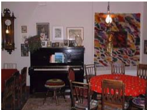
Sali korjauksen jälkeen

Seuraavaksi alkoi kunnostustöiden suurin ja työläin vaihe. Sekä saunarakennuksessa että päärakennuksessa oli todettu ulkovaipan hirsissä paikoin laajojakin lahovaurioita. Etenkin saunarakennuksessa ne olivat niin pahoja, että kokonaisia seinäosia jouduttiin uusimaan. Välillä korjausmiehitys joutui miettimään ”päänsä puhki”, miten rakennusosia tuetaan väliaikaisesti kokonaisten seinien purkutöiden aikana, mutta neuvokkuuden ja sisun avulla, osin myös ”kantapään kautta” saatujen kokemusten myötä toimissa onnistuttiin.