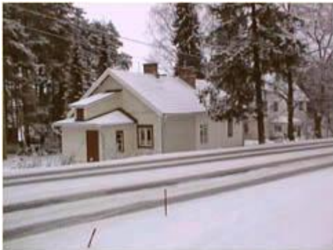
Lepokodin saunarakennus talvella 1999

Kangasalan Lepokodin kunnostus-, maalaus- ja entisöintityöt ovat 21.12.2000 edistyneet siihen tilanteeseen, että voidaan hyvin todeta työstä tehdyn yli 90%. Perusteluna tälle on se, että Lepokodin päärakennuksen 26 huoneesta 20 on kunnostettu valmiiksi, saunarakennus sisäpuolelta kokonaan sekä molempien rakennusten ulkovaipat pääosin kokonaan. Kun vielä huomioidaan, että päärakennuksen kunnostettujen yläkerran huoneiden (9) lähtötilanne oli se, että niiden kunto oli huomattavasti huonompi kuin alakerran huoneissa, oli em. huoneissa runsaasti aikaisemmin vesikaton vuodoista aiheutuneiden vaurioiden korjaamista ja siten pohjatyöt huomattavasti työläämpiä. Nyt nämä vauriot on pääosin (90%) korjattu, ja koska alakerran huonetiloissa näitä vaurioita ei esiinny, voidaan näiden korjaustyöt tehdä siten huomattavasti "kevyemmin".