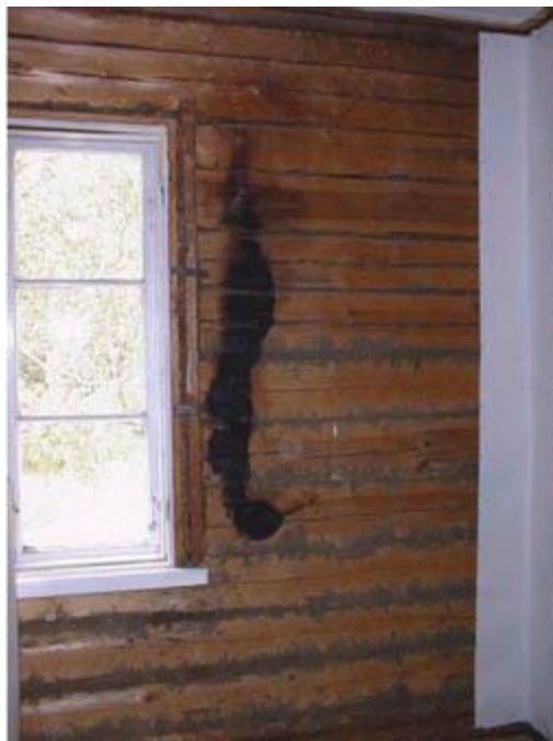
Huone 22: hirsiseinässä oleva tulipalon jälki vuosien takaa.

Ulkovaipan korjaustöiden yhteydessä oli todettu, että keittiön lattian ulkoseinän puoleisella osalla on lahovaurioita, ja siksi lattiakorjaus toteutettiin jo vuonna 1996. Aluksi n. ½ lattiasta purettiin auki, poistettiin kosteat eristeet ja uusittiin lahovaurioituneet runko-osat. Uusi lattialaudoitus tehtiin mitoitukseltaan alkuperäistä vastaavalla lattiaponttilaudalla ja lattia maalattiin lakkamaalilla valmiiksi. Loppuosa keittiöremontista toteutettiin vuonna 1999, mutta tällä hetkelläkin keittiön listoitustyöt ovat kesken.