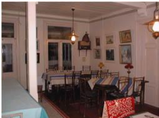
Sali. Viihtyisyys tehdään myös alkuperäisillä kalusteilla!

Mutta toisin kävi! Kesä 1998 oli todella sateinen, ja osittain keskeneräisten sadevesien ohjaustöiden vuoksi tämän huoneen puurakenteet pääsivät kostumaan.